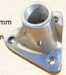
Diam. 7 mm Lxl = 90 x90 mm

● Kits de fixation : une gamme complète est disponible en inox 316L poli miroir. Fournis Complètes avec Embase de fixation en alu, visseries, plaques de renfort sur balcon et anneaux de haubannage.