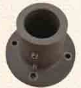
hauteur : 85 mm

Ensemble composé de : 1 tube diam. 42 mm long. 2.60 m 1 Embase inclinable /réglable 2 Anneaux pour Haubannage