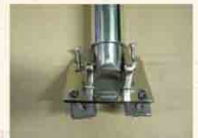
embase Kit K8

● LVMK7 : Embase articulée +tube et anneau haubannage diam. 38,1mm long 2,60 m