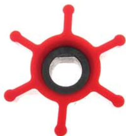
Gamme 'Rouge' pour pompes de transfert