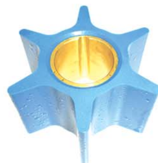
Gamme 'Bleu' pour pompes a eau de mer