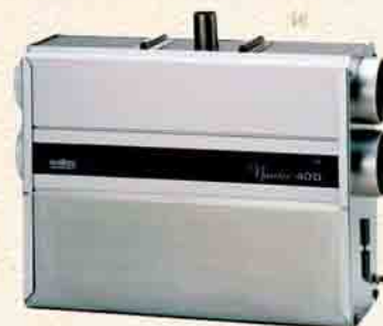
Nautic 40 D