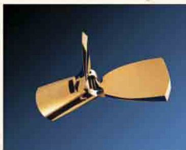
Hélice Pales Repliables